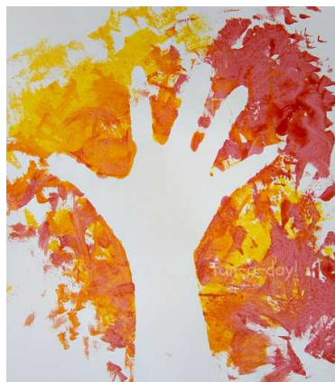
Atividade pintura em negativo